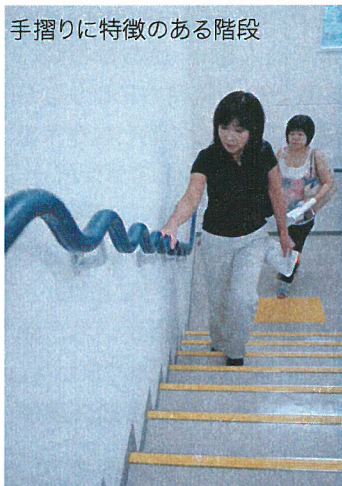
手摺りに特徴のある階段