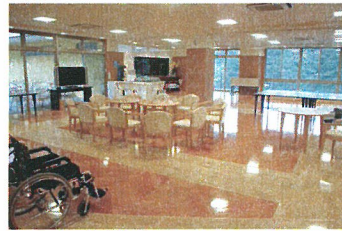
食堂兼共用ホール

ソーシャルコート神戸北の費用 ●入居一時金 350万円 ●家賃 79,000円～92,400円(月額) ●管理費 50,000円(月額一律) ●食費 朝食:315円 昼食:525円 夕食:1,260円 *希望者のみ、料金別支払い (問い合わせ先: ㈱ ソーシャルライフ ☎ 0120-14-6363)