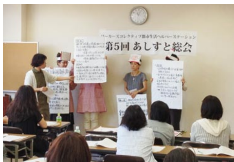
総会での研修発表の様子。