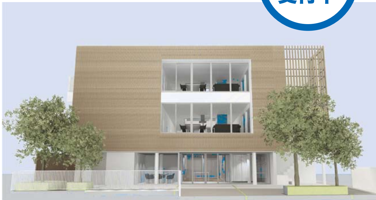
尼崎市武庫之荘本町 1 丁目に建設中のパンセ武庫之荘（完成予想図）。3 階建の建物のうち、2 階・3 階がサービス付き高齢者向け住宅（全 20 戸）、1 階に小規模多機能型居宅介護事業所と、訪問介護・居宅介護支援事業所「あしすと武庫之荘」が入ります。