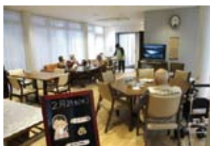
家庭的な雰囲気の小規模多機能ディールーム