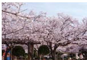
春には桜が咲き誇る武庫庄公園