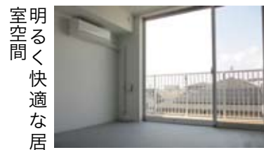
明るく快適な居室空間